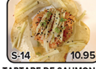
TARTARE DE SAUMON (5)