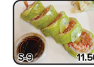
SEXY KIWI (5)