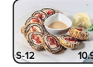
DRAGON EYE (8 frits / fried)