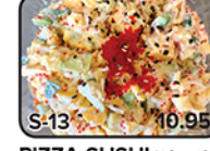
PIZZA-SUSHI (6 frits / fried)

feuille de soya, goberge, mangue, oignon frit, avocat, tempura, masago. Ext.: thon/soya sheet, crabstick, mango, fried onion, avocado, tempura, masago. Outside: tuna thon épicé, anguille, goberge, échalotes, omelette, tempura, avocat / spicy tuna, eel, crabstick, shallots, omelette, tempura, avocado saumon, poisson blanc, tobiko, carotte, échalotes / salmon, white fish, tobiko, carrot shallots