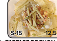
TARTARE DE THON (5)