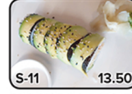
BLACK DRAGON (5)